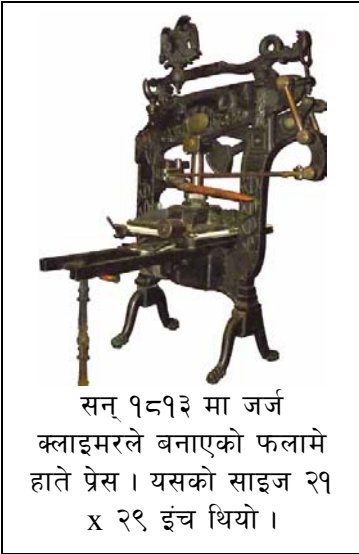
सन् १८१३ मा जर्ज क्लाइमरले बनाएको फलामे हाते प्रेस । यसको साइज २१ X २९ इंच थियो ।