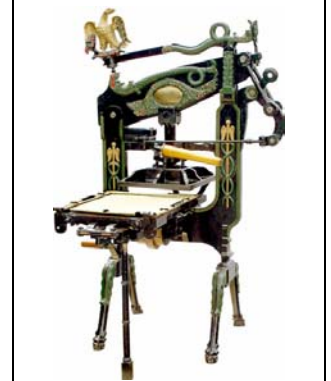
सन् १८३० मा जर्ज क्लाइमरले बनाएको फलामे हाते प्रेस । यसको साइज २० X ३० इंच थियो ।

वेबसाइटबाट प्राप्त जानकारी अनुसार अमेरिकाको फिलाडेल्फिया राज्यका कारीगर जर्ज क्लाइमर (सन् १७५२ – १८४३) ले सन् १८०० देखि युरोपमा प्रचलित फलामे हातेप्रेसजस्तै काठको हातेप्रेस बनाउन थालेका रहेछन् । उनले १८१३ मा आफ्नै मौलिक विशेषताहरू भएको कोलम्बियन हातेप्रेस आविष्कार गरेका रहेछन् । उनले पुरानो खालको प्रेसमा धेरै सुधार गरेका थिए । खास गरी लिभर प्रणालीमा धेरै सुधार गरेर उनले थोरै बल लगाएर धेरै कागतमाथि धेरै दबाव दिन सकिने बनाएका थिए । माथि राखिएको बाजको मूर्तिले दुइटा काम गर्ने रहेछ । एक त यो अमेरिकाको राष्ट्रिय चिन्ह भयो । अर्को काम कागतमा छाप लिइसकेपछि माथिको गहुँगो ढिक्कलाई उचाल्नका लागि चाहिने विपरीत बल (काउण्टर वेट)को रूपमा पनि त्यो बाजको काम लिइएको रहेछ ।