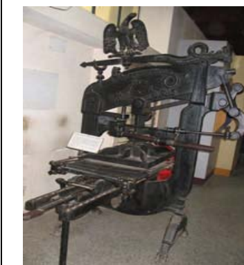
विश्वेश्वरैया संग्रहालयमा भएको कोलम्बियन प्रिन्टिङ प्रेस

यो प्रेस बंगलोरको प्रिन्टिङ, स्टेसनरी एण्ड पब्लिकेसनका निर्देशकले दान गरेका थिए । जिन्सी क्रमसंख्या एसीसीएन. नं. ७६.३१४ थियो ।