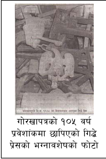
गोरखापत्रको १०५ वर्ष प्रवेशांकमा छापिएको गिद्धे प्रेसको भग्नावशेषको फोटो

कोलम्बियन प्रेस टाइप गरेर गिद्धेप्रेसको फोटो र त्यसबारे थुप्रै जानकारी भेटाउनसक्छ । अहिले पनि कतिपय व्यक्ति र संस्थासँग चालु अवस्थाको गिद्धेप्रेस छ, र उनीहरू त्यो प्रेस बेच्न चाहन्छन् । एउटाले त त्यसको मोल पैतीस हजार डलर राखेको छ ।